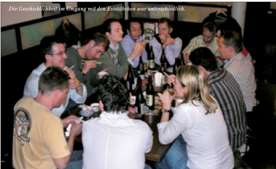
Die Geschicklichkeit im Umgang mit den Essstäbchen war unterschiedlich.

Den Gesamteindruck der Reise fasste er so zusammen: „Die Heimat der Sanyo-Klimageräte zu besuchen, das Land, die Menschen, die Mentalität, die Hektik, die Organisation, die Freundlichkeit zu erleben und hinter die Kulissen von Sanyo zu blicken, ist immer wieder ein unvergessliches Erlebnis.“ Dem schlossen sich die Gäste gerne an.