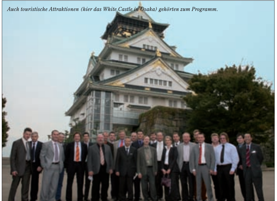
Auch touristische Attraktionen (hier das White Castle in Osaka) gehörten zum Programm.

die Gäste einen ausführlichen Blick hinter die Kulissen der Klimageräte-Produktion werfen. Bei allen Themen im Klimabereich wurde das Bestreben der Japaner deutlich, so energiesparend und umweltschonend wie möglich zu arbeiten. Dies war für die Kaut-Kunden ein wichtiger Informationsbereich denn das Thema Umwelt spielt auch in der EU eine immer wichtigere Rolle.