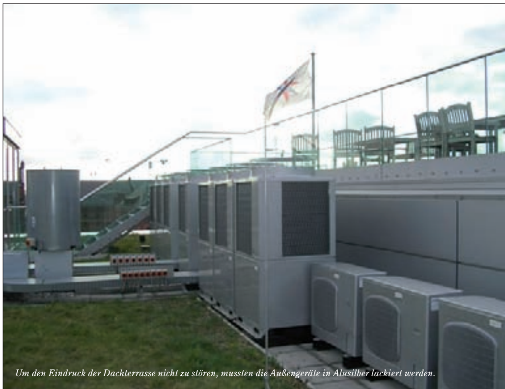
Um den Eindruck der Dachterrasse nicht zu stören, mussten die Außengeräte in Alusilber lackiert werden.

stärksten Schlepper des Hamburger Hafens in Betrieb nehmen. Fairplay 1 schafft mit seinen beiden jeweils 2500 PS leistenden Motoren eine Pfahlzugkraft von 70 Tonnen. Die Stärke eines Schleppers wird in der Kraft gemessen, die in der Zugkraft