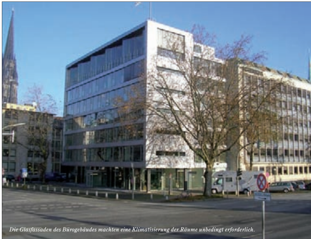
Die Glasfassaden des Bürogebäudes machten eine Klimatisierung der Räume unbedingt erforderlich.

Neben dem neuen Gebäude konnte das Unternehmen kürzlich auch den